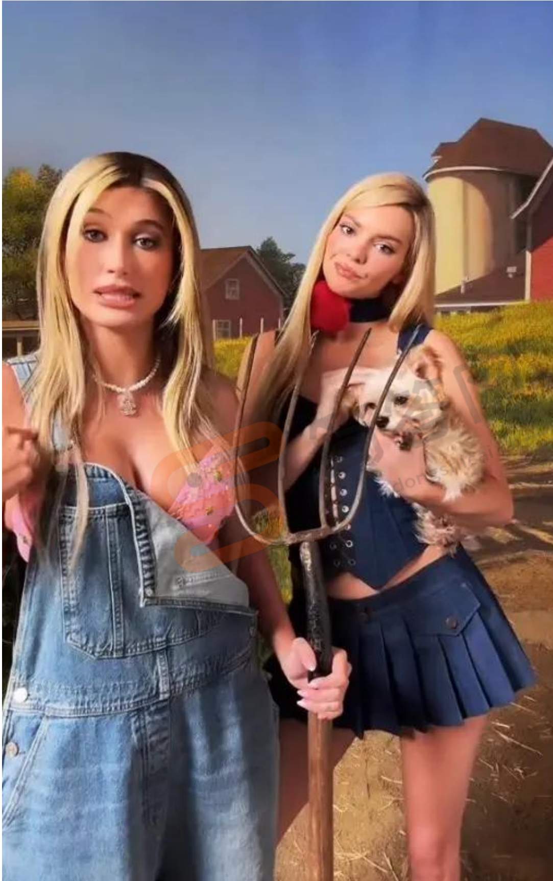
Hilton portrayed herself as a completely spoiled rich girl in the show, often holding her